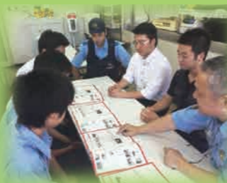
職業インタビューの様子