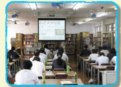
学習塾教員様対象学校説明会の様子

6月19日(金)、30校の学習塾から37名の先生方が来校されました。今年、総合学科についての説明や授業参観に加えて、在校生の代表(3年生)や卒業生(8期生=現在大学生)から芦間高校の印象や芦間高校で頑張ったことなどを語っていただきました。さらに、学校長から本校での授業改革の取り組みや入学者選抜の変更点等についての説明がありました。説明会終了後のアンケートでは、「総合学科のしくみがよく分かった。」「来年も開催してほしい。」「授業参観で生徒の様子を見ることができてよかった。」などの感想をいただきました。塾の先生方は、本校に進学した塾卒業生の方々のことをとても気にかけておられました。とてもありがたいことです。塾の先生方に感謝申し上げます。