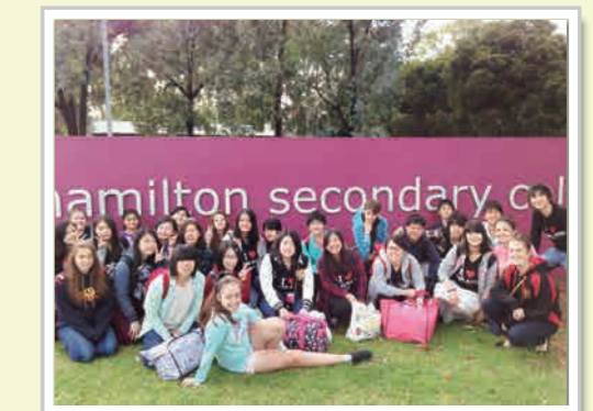
今春の語学研修の様子

毎年、3月に、オーストラリアのアデレード(南オーストラリア州の州都。オーストラリアで5番目に大きい都市)へ語学研修に行きます。語学研修生のみんなが「行ってよかった。」という感想をもっています。「第二の故郷になった。」「また、オーストラリアに行きたい。」という研修生もいます。とても充実した内容の取り組みです。この語学研修にトライしたい人は、ぜひ、芦間高校へ。